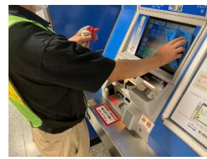
駅構内の消毒作業