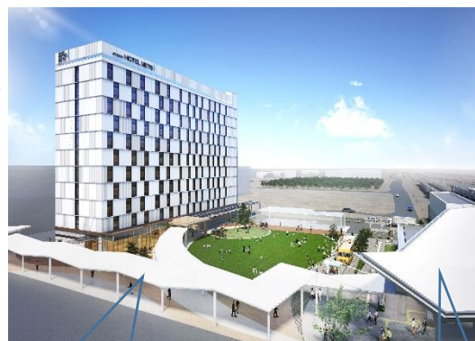
歩行者ネットワーク