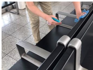
待合室の消毒作業

※職員の熱中症予防のため、お客様と近接しない事を確認したうえでマスクを着用しない場合がございます。