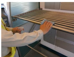
車内の消毒作業 (スカイライナー)