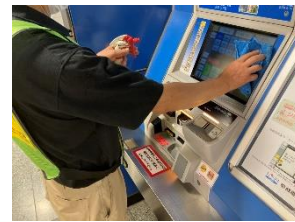
駅構内の消毒作業