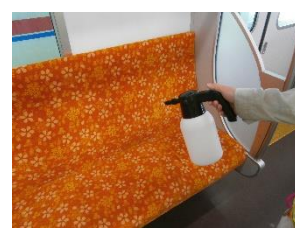
車内の消毒作業 (一般車両)

お客様におかれましても、手洗い・うがい・咳エチケットのほか、時差出勤など混雑時間帯を避けたご乗車や、車内換気のため天候や混雑状況に応じた窓上部の開閉等へのご協力、また、可能な限り、マスクの着用と会話の際の周囲へのご配慮をお願い申し上げます。