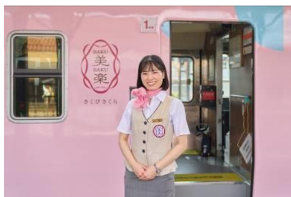
SAKU美SAKU楽アテンダント