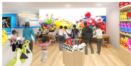
キッズ向けグッズ販売 イメージ