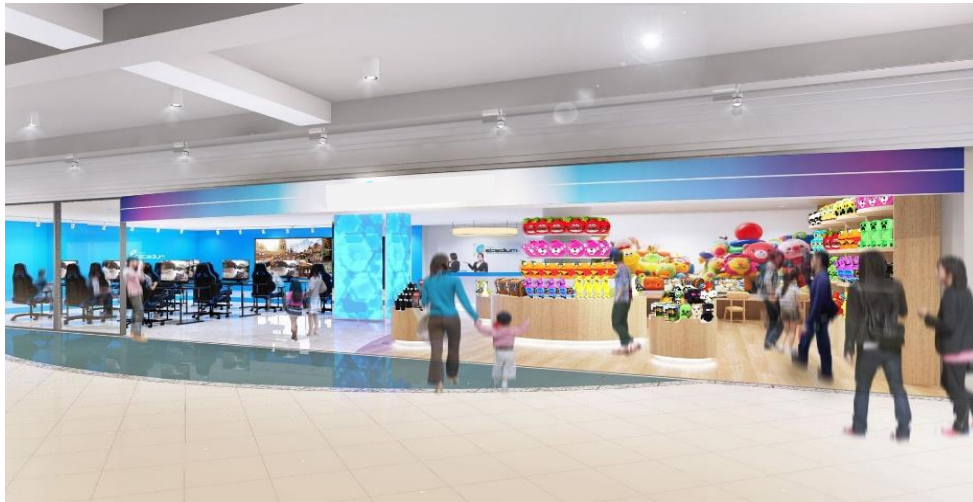
e スタジアム泉佐野 外観 イメージ