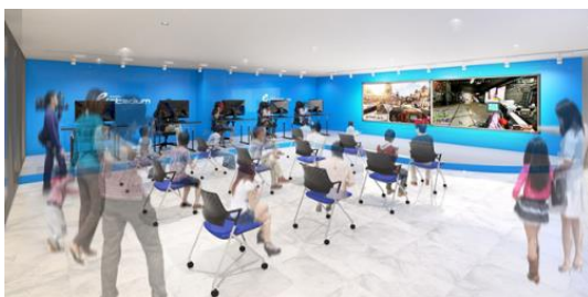
ブース/ステージ イメージ