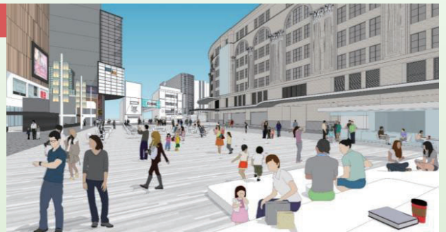
なんば駅前広場の将来イメージ