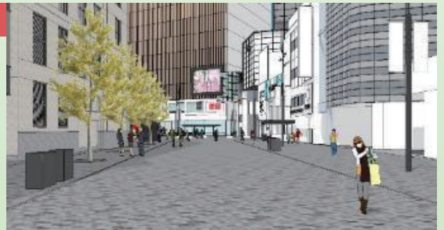
なんさん通りの将来イメージ