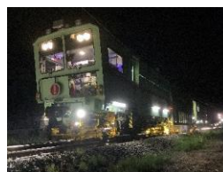
マルチプルタイタンパー