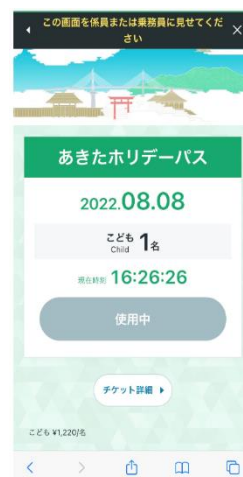
電子チケット画面イメージ

https://lp.tohoku-maas.com/ （スマートフォン専用サイト）