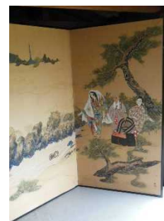
▲長尾寺静御前の襖絵

四国に存在する地域資源・文化資源を掘り起こし、地域と協働して付加価値付けされた観光素材・文化素材に磨き上げ、観光による地域活性化を目指す取り組みです。