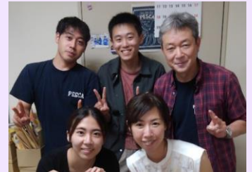
【鹿児島大学水産流通学研究室の皆さま】