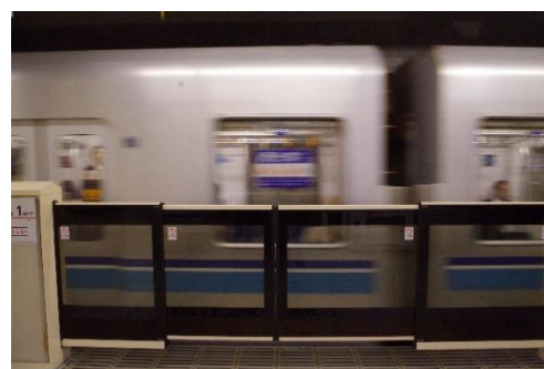
東西線九段下駅大開口ホームドア