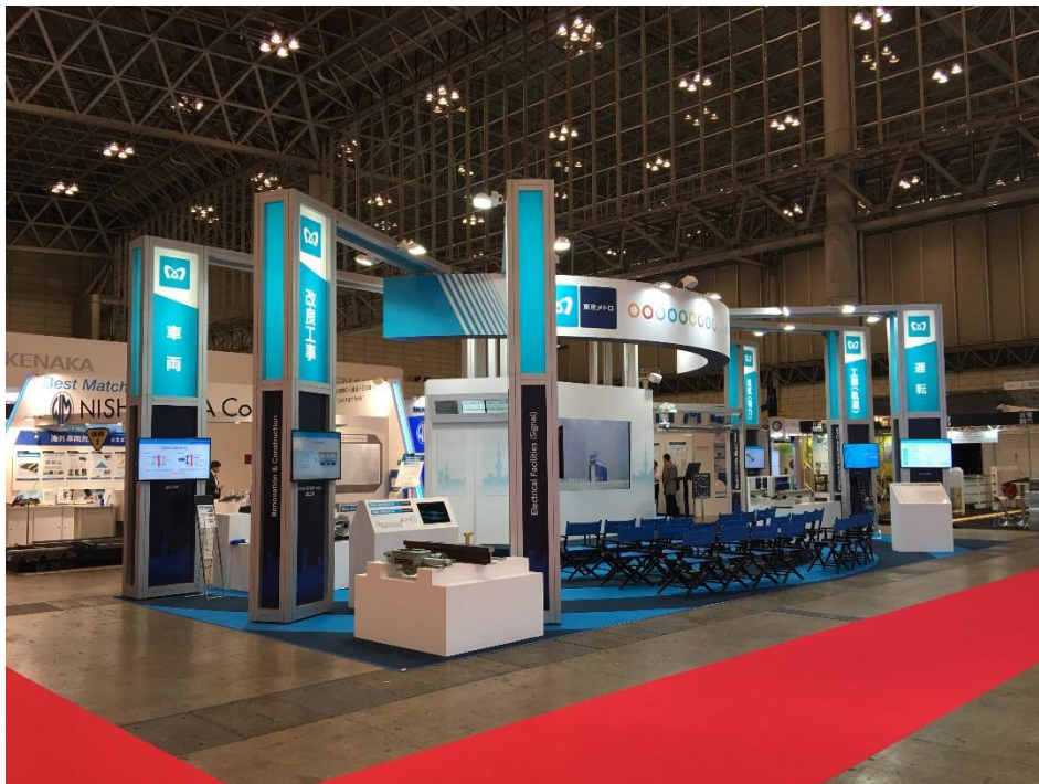
鉄道技術展 2015の様子

東京メトロでは、新たな技術の導入・開発に取り組むことで、さらなる企業価値の向上に努めていきます。