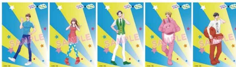
コラボポスターのイメージ