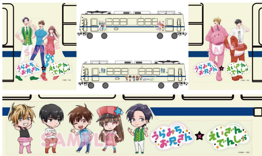
車体ラッピングのイメージ