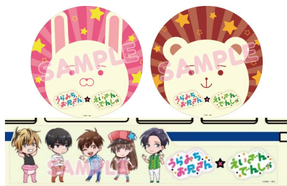
コラボヘッドマーク、ラッピングのイメージ