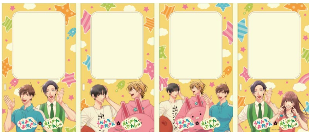
車内ラッピングのイメージ