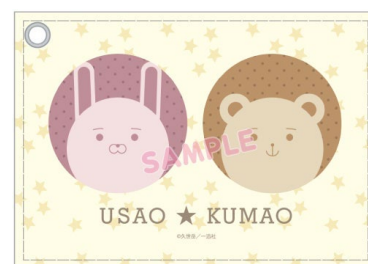
パスケースのイメージ