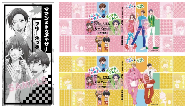
コラボきっぷのイメージ