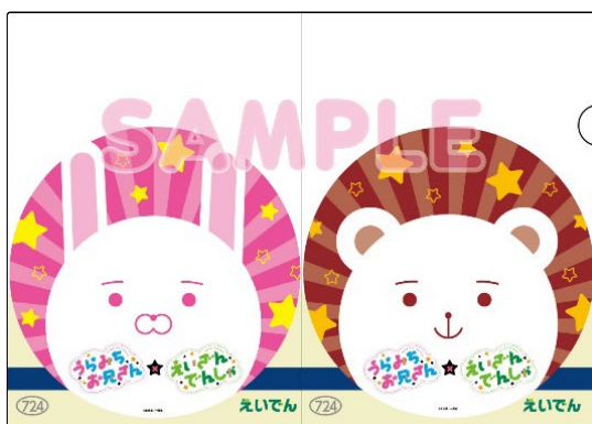
クリアファイルのイメージ