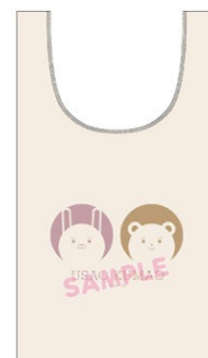
マルシェバッグのイメージ