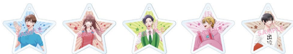
アクリルキーホルダーのイメージ