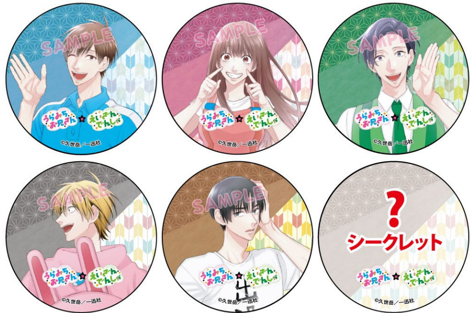
缶バッジのイメージ

※新型コロナウイルスの感染拡大防止策を実施するほか同ウイルス感染拡大状況により、販売開始日時を変更する場合がございます。