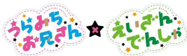
コラボロゴのイメージ

全ての企画には、「うらみちお兄さん×えいざんでんしゃ」のコラボロゴを使用します。