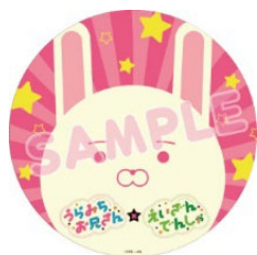
ヘッドマークのイメージ