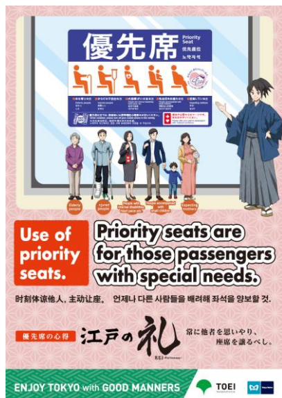
「優先席」ポスター（イメージ）