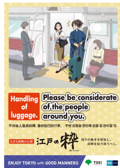
「手荷物」ポスター（イメージ）