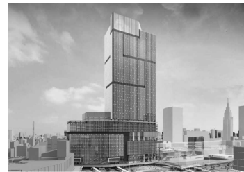
(新宿駅西口地区開発計画/建物イメージ)

不動産事業の当連結会計年度の業績は、営業収益が137億4千万円（前期比0.8%増）、営業利益が53億4千7百万円（前期比16.0%増）となりました。