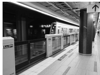
(ホームドアの整備事例)

お客様の円滑な移動の実現については、お身体の不自由なお客様をはじめとした全てのお客様に安心してご利用いただけるよう、エレベーター及びエスカレーターの整備を進めたほか、2025年度までのホームドア全路線全駅への整備をはじめとした各種バリアフリー設備の整備を着実に推進するため、2023年3月に鉄道駅バリアフリー料金を導入いたしました。また、東京メトロmy！アプリによる号車ごとのリアルタイム混雑状況の配信を全路線に拡大いたしました。さらに、安全性及び車内での快適性を向上させ、環境にも配慮した新型車両として、半蔵門線に18000系車両の導入を進めております。