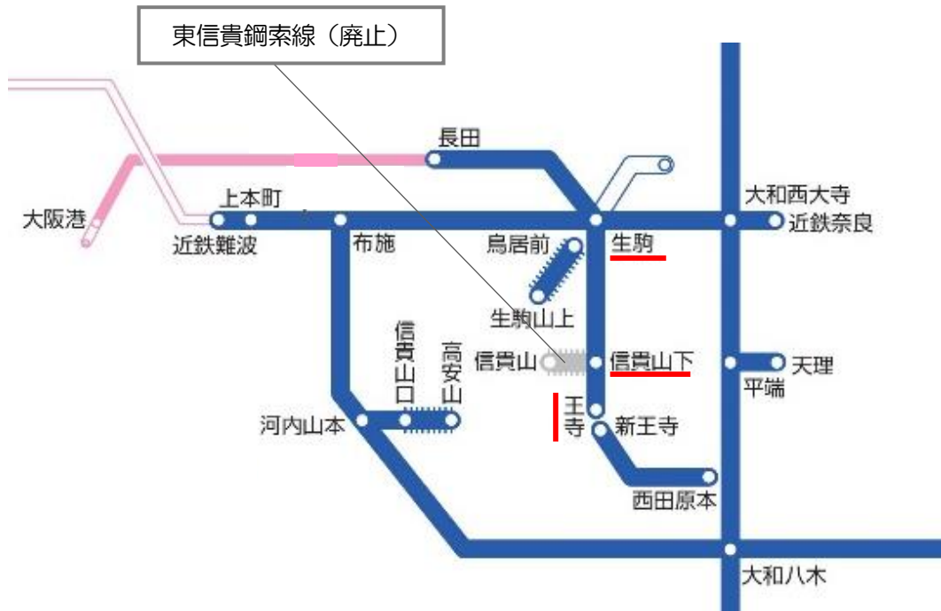
路線図：1972年4月～1987年3月（当時）