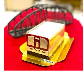
電車ケーキ（イメージ）