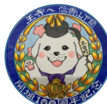
西和清陵高等学校