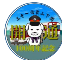
王寺工業高等学校