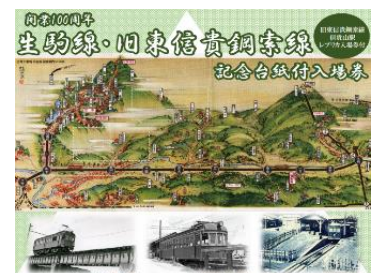
記念入場券(画像は記念台紙表紙)