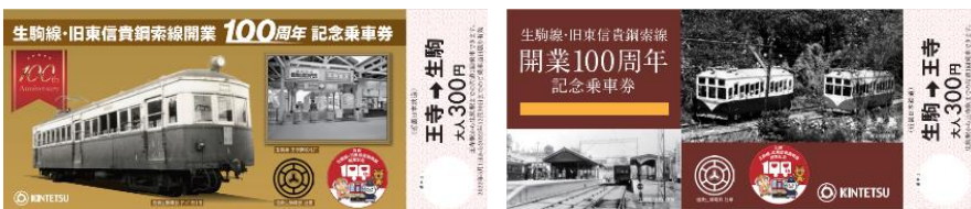
記念乗車券(1セット)