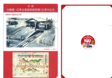
記念クリアファイル