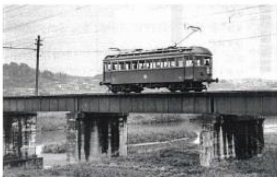
信貴生駒電気鉄道の電車（王寺・信貴山下間）