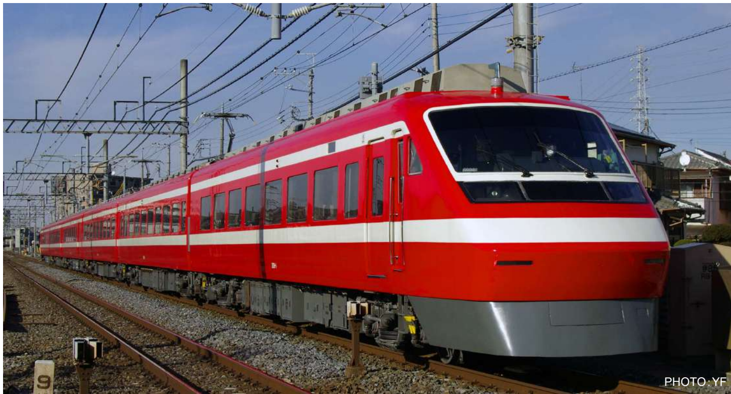
東武鉄道株式会社商品化許諾済