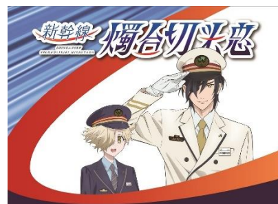
【ヘッドレストカバー】