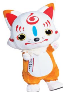
【おっきい こんのすけ】

※特別展及び『刀剣乱舞-ONLINE-』コラボ企画の詳細については、米沢市上杉博物館のHPをご覧ください。