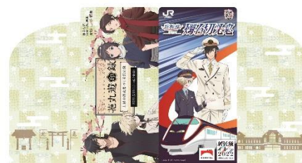
【チケットホルダー】