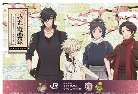
【オリジナルポストカード】

※設置箇所すべてのスタンプを取得すると 景品と引換えします。景品はなくなり 次第終了となります。