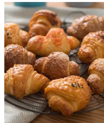
クロワッサン各種 1個65円～