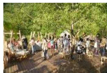
イベントのイメージ