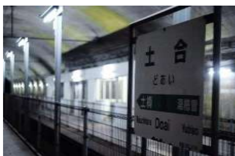
土合駅地下ホーム

株式会社 VILLAGE INC（以下、VILLAGE INC.）は、ビール醸造を通じて自然への取り組みを行うブルワリーの集まりである Brewing for Nature と東日本旅客鉄道株式会社 高崎支社(以下、JR 東日本高崎支社)、JR 東日本スタートアップ株式会社（以下、JR 東日本スタートアップ）、地域の皆さまと協力し、群馬県の上越線土合駅にある「DOAI VILLAGE」において、地下ホームで熟成させたクラフトビールを楽しめるイベント『もぐらビアキャンプ』を開催します。このイベントを通じて、みなかみの魅力を発信すると共に、イベント収益の一部を森林保全活動に寄付することで、地域の活性化や自然環境の保護への取り組みを推進していきます。