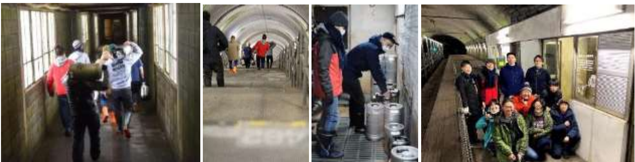
クラフトビールを運ぶ様子

土合駅の下りホームは上越線のトンネル内にあり、駅舎から標高差が70mあり、486段もの階段を下るため「日本一のモグラ駅」と呼ばれています。そんな地下ホームの小屋を活用して、一昨年からは、地元みなかみ町のオクトワンプルーイングを始め、様々なブルワリーが参画し、クラフトビールを貯蔵してきました。「モグラ熟成ビール」は土合駅の地下ホームで熟成させたビールの総称であり、既に250リットルを超えるクラフトビールが貯蔵されています。発酵の終了したビールを地下ホームの低温の環境のもと、穏やかに熟成させることで、味や香りを調和させることができ、よりおいしいクラフトビールとなります。今回のイベントではこの「モグラ熟成ビール」を解禁し、お客さまに提供いたします。