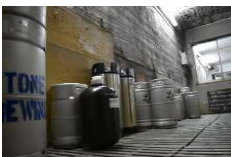
熟成させている様子