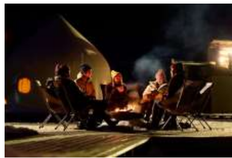
DOAI VILLAGE 滞在イメージ