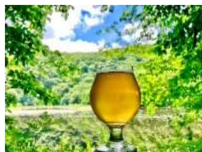
モグラ熟成ビールのイメージ