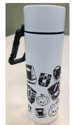
オリジナルタンブラー

車内にてエンタメ NAGANO クロスワードパズルと応募ハガキをお配りします。応募ハガキにキーワードをご記入の上、郵送いただくと抽選でJRオリジナルタンブラーが当たります。