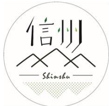
上諏訪駅社員考案ロゴマーク