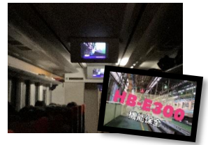
トンネル内で動画上映会

車内販売をご購入のお客さまへオリジナル缶バッジをプレゼントいたします。 （お一人さま一つ）