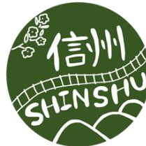
長野駅社員考案ロゴマーク