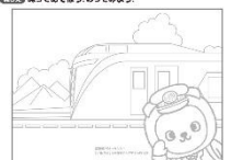
(案内チラシ 表・裏)