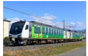
HB-E300系リゾートビューふるさと

https://www.jreast.co.jp/railway/joyful/resortfuru.html