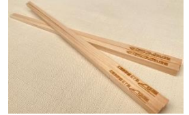
長野県産木製オリジナルお箸

デジタル観光ツアーアプリ「SpotTour」を使い、長野・諏訪エリアの魅力溢れる歴史巡りの旅をお楽しみいただけます。条件をクリアすると「長野県産木製オリジナルお箸」や「各駅オリジナル御朱印」をプレゼント。 ※詳しくはプレスリリースをご参照ください。