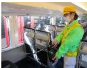
座席の消毒作業 (スカイライナー)