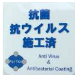
「抗菌・抗ウイルス施工済」ステッカー (鉄道車両内に掲示)