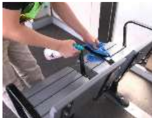
待合室の消毒作業

駅構内および鉄道車両の消毒については、定期に加え必要に応じて実施しています。なお、お客様が手を触れる箇所(券売機、エレベータ内、お手洗い、手すり、つり革、座席等)を中心に、抗菌・抗ウイルス加工を実施しています。一般車両では係員による窓上部の開閉、スカイライナー車両(イブニングライナー・モーニングライナー含む)では換気装置により、車内換気を実施しています。