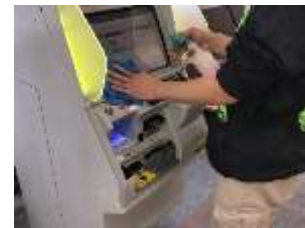
駅構内の消毒作業