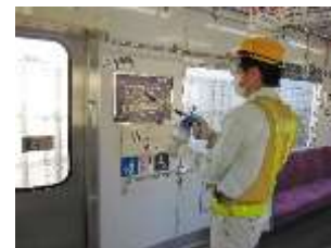
車内の消毒作業 (一般車両)

お客様におかれましても、手洗い・うがい・咳エチケットのほか、時差出勤など混雑時間帯を避けたご乗車や、車内換気のため天候や混雑状況に応じた窓上部の開閉等へのご協力、また、可能な限り、マスクの着用と会話の際の周囲へのご配慮をお願い申し上げます。