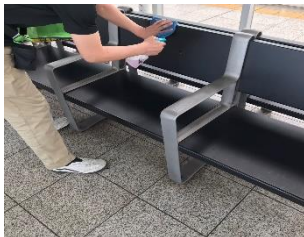
待合室の消毒作業

駅構内および鉄道車両の消毒については、定期に加え必要に応じて実施しています。なお、お客様が手を触れる箇所(券売機、エレベータ内、お手洗い、手すり、つり革、座席等)を中心に、抗菌・抗ウイルス加工を実施しています。一般車両では係員による窓上部の開閉、スカイライナー車両(イブニングライナー・モーニングライナー含む)では換気装置により、車内換気を実施しています。