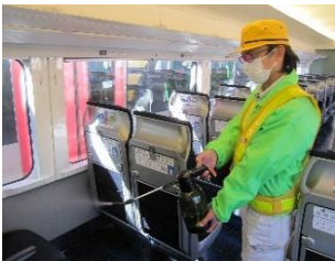
座席の消毒作業 (スカイライナー)