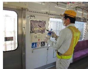
車内の消毒作業 (一般車両)

お客様におかれましても、手洗い・うがい・咳エチケットのほか、時差出勤など混雑時間帯を避けたご乗車や、車内換気のため天候や混雑状況に応じた窓上部の開閉等へのご協力、また、可能な限り、マスクの着用と会話の際の周囲へのご配慮をお願い申し上げます。