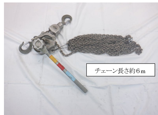
チェーン式張線器