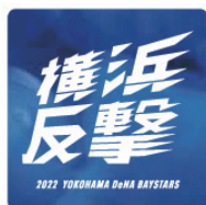
2022年シーズンスローガンロゴ