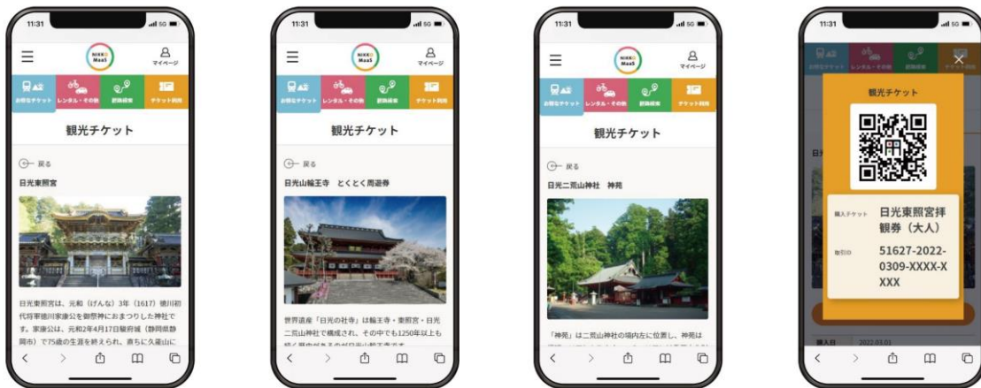
▲「NIKKO MaaS」観光チケット（イメージ）