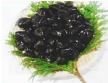
【十三湖産 大和しじみ】

釣り人たちの間で「幻の魚」と呼ばれる鱒ヶ沢町のイトウは、「白神山地」の清水を使用して養殖しているため、食味も優れており、川のトロとも言われています。