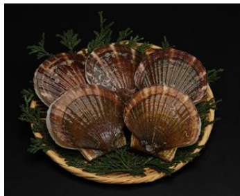
【陸奥湾産・ホタテ】

肉厚で身が締まり、豊かな香りと甘みが特徴。くせがなく、刺身のほか、しゃぶしゃぶ、酢味噌和え、貝焼きなどで食べられています。