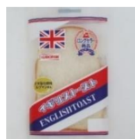
【イギリストースト】