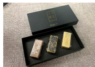
【くる東北(北東北3点セット)】 (青森・秋田・岩手各県 Ver.)

「くる東北」の開発に際しては各県の素材選びから自らその土地、その土地に足を運んでこだわっています。工場などで大量生産せず、ホテルで一つひとつ手づくりすることも料理長がこだわったポイント。青森、秋田、岩手各県の米粉と地域を想起させる食材を合わせたホテルメトロポリタン仙台オリジナルスイーツです。(上野駅初出品)