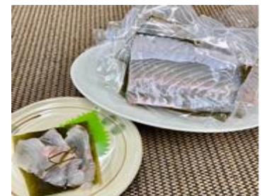
【ヒラメ昆布締め(サク)】

白神山地から注ぐ岩木川の淡水と日本海の海水が交じり合う十三湖は、しじみにとって最高の環境で、コクのある濃厚な出汁が取れ、「黒いダイヤ」と呼ばれています。