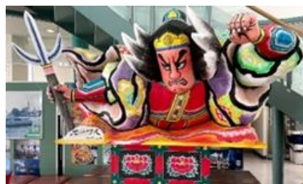
「ミニ青森ねぶた」がお出迎え