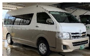
「よぶのる角館」車両イメージ