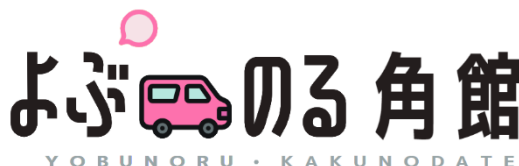
「よぶのる角館」ロゴ

オンデマンド交通が、文字通り、「呼んで」「乗る」乗り物であることをシンプルに表しました。下記のロゴを目印として、オンデマンド車両や宣伝物などに掲出します。