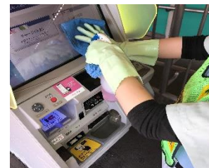
駅構内の消毒作業