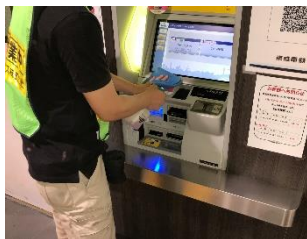
券売機の消毒作業

駅構内および鉄道車両の消毒については、定期的に加え必要に応じて実施しています。なお、お客様が手を触れる箇所(券売機、エレベータ内、お手洗い、手すり、つり革、座席等)を中心に、抗菌・抗ウイルス加工を実施しています。一般車両では係員による窓上部の開閉、スカイライナー車両(イブニングライナー・モーニングライナー含む)では換気装置により、車内換気を実施しています。