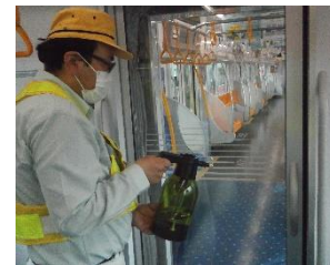
ドアの取っ手の消毒作業 (一般車両)

お客様におかれましても、手洗い・うがい・咳エチケットのほか、時差出勤など混雑時間帯を避けたご乗車や、車内換気のため天候や混雑状況に応じた窓上部の開閉等へのご協力、また、可能な限り、マスクの着用と会話の際の周囲へのご配慮をお願い申し上げます。