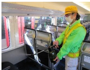
座席の消毒作業 (スカイライナー)