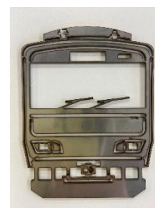
【「鉄製」印イメージ(E231系)】