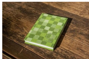
【御朱印帳イメージ】