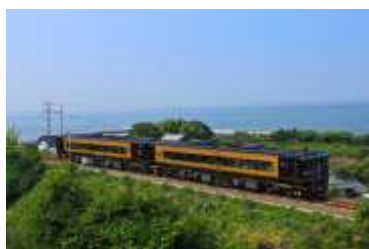
特急「A列車で行こう」

往路は特急「あそぼーい！」に、復路は特急「A列車で行こう」にご乗車いただき、2つの異なる列車での旅をお楽しみください。ご家族・ご友人をお誘いあわせの上、ご参加心よりお待ちしております。