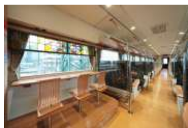
特急「A列車で行こう」車内