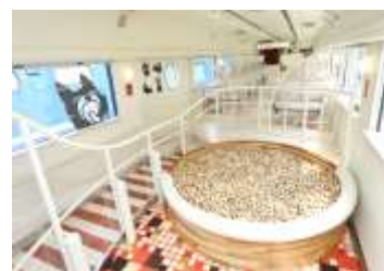
特急「あそぼーい！」車内