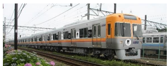
《井の頭線車体ラッピングイメージ》