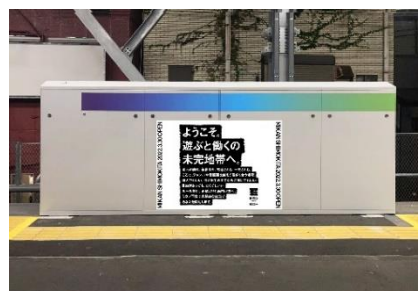
《京王井の頭線下北沢駅特別装飾・ラッピング車両イメージ》