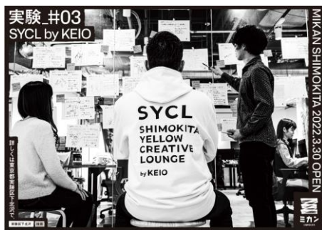
《キーヴィジュアル「企む背中」》