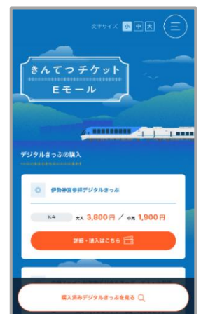
きんてつチケットEモール トップ画面イメージ

※ Apple Pay は、米国および他国々で登録された Apple Inc.の商標です。 ※ Google Pay は Google LLC の商標です。