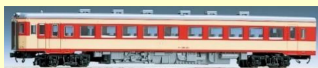
キハ26形(急行色・一段窓)