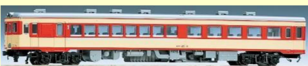
キロハ25形(急行色・一段窓)