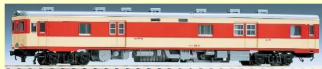
再生産 キュニ26形(急行色)