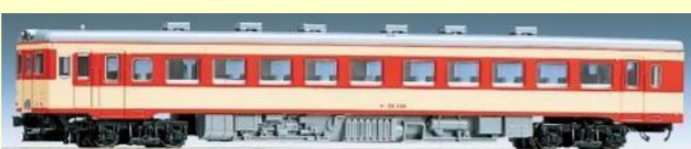
キハ55形(急行色・一段窓)