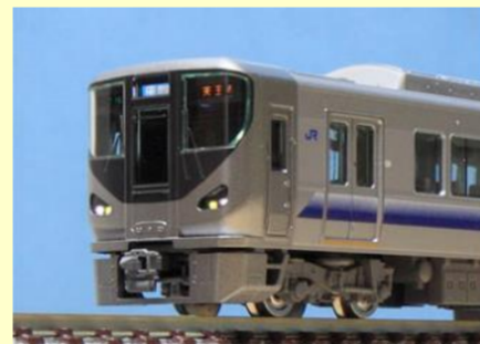
225系 関空・紀州路快速 好評発売中