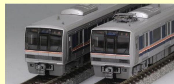
207系 新塗装 好評発売中