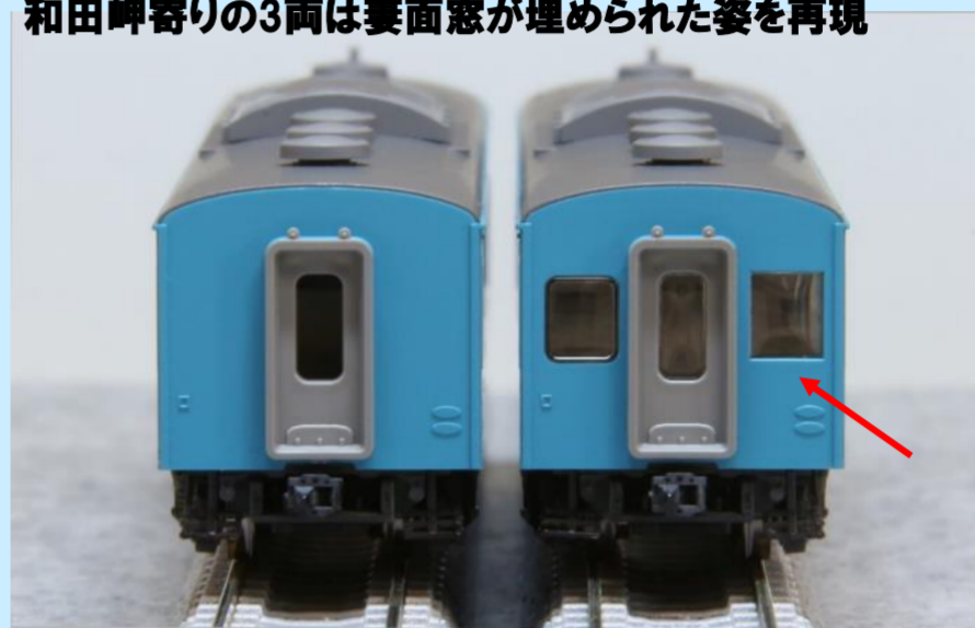
各画像は試作、開発中のものです 実際の製品とは異なる場合があります

兵庫寄りの3両(クハ103形・モハ103形・モハ102形)は妻面窓が固定化された姿を新規製作で再現 和田岬寄りの3両は妻面窓が埋められた姿を再現