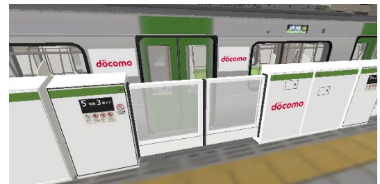
バーチャル空間でのホーム、車両と広告イメージ

「共創」の第一歩として、NTT ドコモと VAW 内での連携を開始します。さらに、今後の XR 領域の発展に向けた取り組みを推進していくことで、NTT ドコモ、JR 東日本、jeky の 3 社で合意しました。