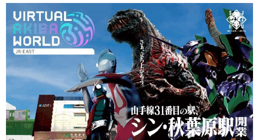
「シン・ジャパン・ヒーローズ・ユニバース」コラボ VAW オリジナルキービジュアル

日本を代表する“ヒーロー”4 作品によって構成された企画「シン・ジャパン・ヒーローズ・ユニバース」とコラボレーションし、コラボ期間中はバーチャル秋葉原駅を「シン・秋葉原駅」と名付けます。バーチャル空間上に VAW オリジナルデザインのグラフィックと各キャラクターが登場し、来場者を出迎えます。