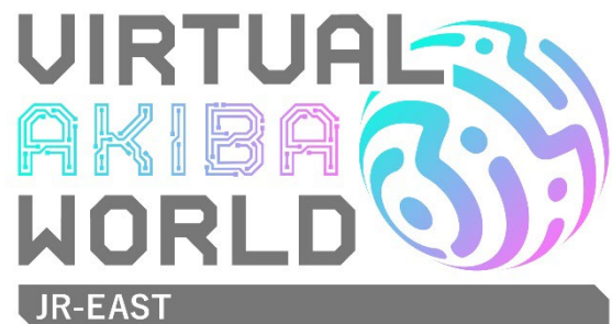
VAW 外観・ロゴ ※画像は開発中のものです