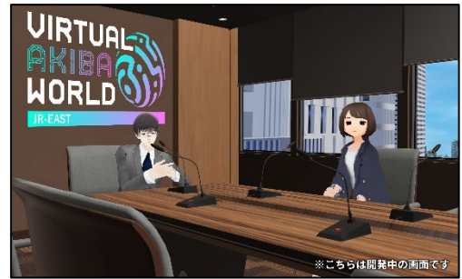
「オフ会ルーム」イメージ

入場者同士でのコミュニケーションができる空間「オフ会ルーム」を、VAW 内の機能として実装します。共通の話題で盛り上げられる仲間とルームを作成したり、オンライン飲み会の代わりとして VAW で集合したりと、まるでリアルで集まっているかのような感覚を味わうことができます。