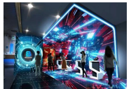
リアル展開のイメージ

リアルの駅空間で、XR の世界観を体験できるスペースを造成します。リアルとバーチャルの融合を加速させ、リアルの駅空間とバーチャル空間とのお客さまの往来を活性化し、クライアントにバーチャル上での広告展開と販売機会の提供を行います。例えば、リアル空間で出稿した駅広告がバーチャル空間でよりダイナミックに表現されたり、バーチャル空間で購入した商品がリアル空間でシームレスに受け取れるなど、JR 東日本だからこそ実現できる、新しい日常の創造を目指します。