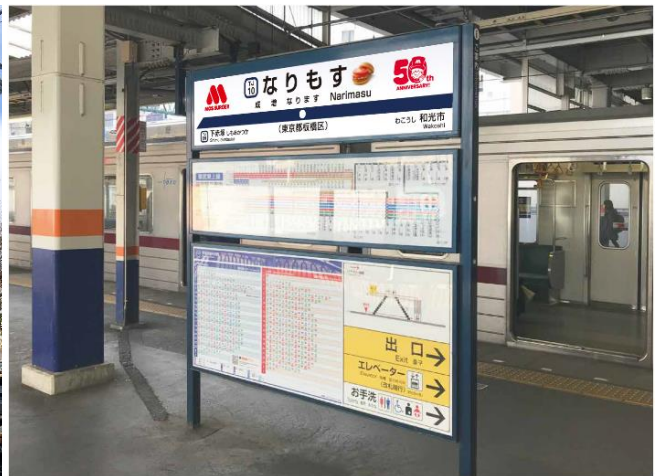
【なりもす駅看板】※画像はイメージです。