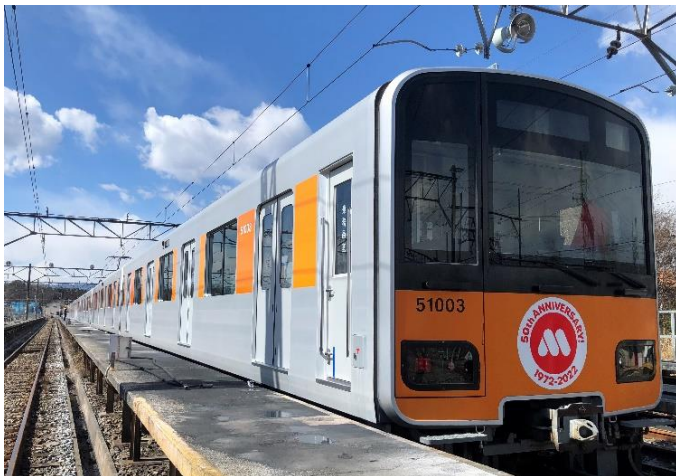
【オリジナルヘッドマークをつけた車両】

モスバーガー1号店がある東京都板橋区の東武東上線 成増駅などで東武鉄道株式会社（本社：東京都墨田区）とのコラボレーション企画を実施します。2022年3月8日（火）～4月3日（日）の期間、「成増駅」ホームと南口の駅名看板を「なりもす駅」に変更します。また東上線車両1編成の先頭部、最後尾にオリジナルヘッドマークをつけて、「なりもす駅」を含む池袋駅から小川町駅の間で運行します。更に、同車両内や池袋駅1F南口改札にも「なりもすへ行こう！」と書いたフラッグを掲出し、生まれ故郷である成増への感謝の気持ちを表現し、地域活性化を図ります。