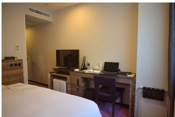
ホテルメッツ水戸