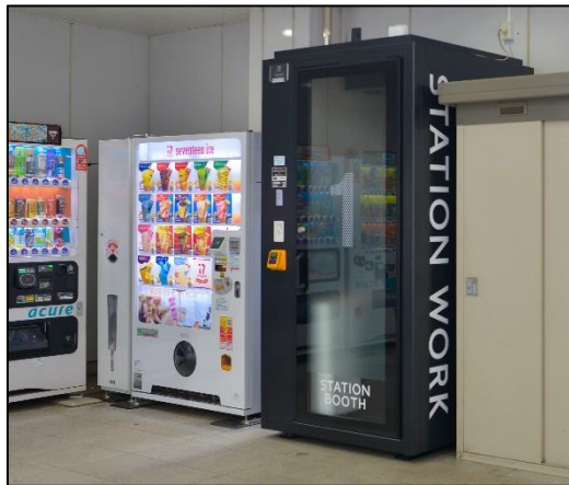
ひたち野うしく駅改札外