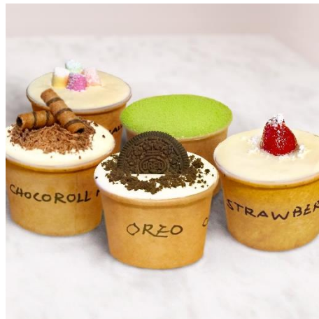
⑧カップティラミス 各400円

韓国でブームになっているフルーツやチョコなどをトッピングしたカップ型のティラミス。オレオやストロベリーなどラインナップは9種類！