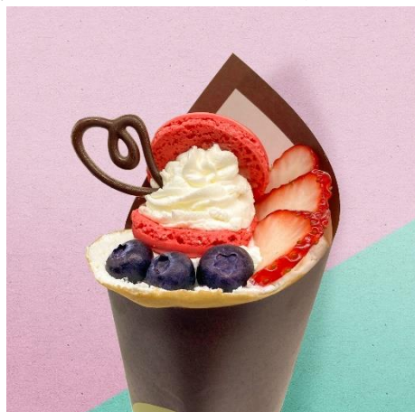
⑦太っちょマカロンと ミックスベリーロール 800円

韓国で人気の太っちょマカロン(トゥンカロン)をクレープにトッピング！イチゴとブルーベリーを合わせた見た目もかわいい一品です！