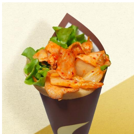
⑤豚キムチロール 700円

自慢の甘めの生地とレタスで、豚キムチを包み込みました。甘さと辛さのバランスが絶妙な一品です。食べごたえも十分！