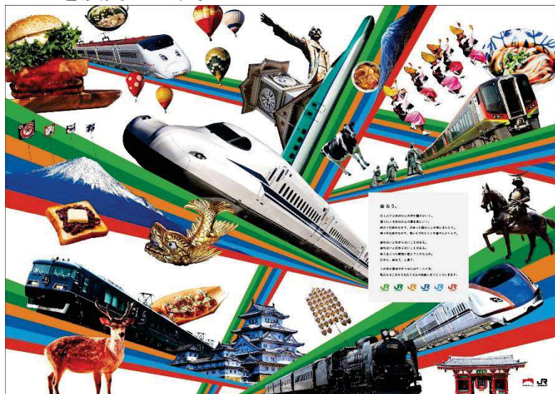
ポスター（イメージ）

全国のJRの駅にて、JR各社の6色ラインをベースに、お客さまの想いをのせた列車が日本中を駆け抜け、各地を繋いでいる様子を表現したポスターやスペシャルムービーを展開します。