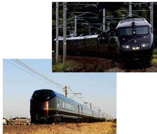
旅行商品で利用する列車（イメージ）