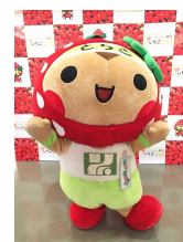
とちまるくん (イメージ)

※本リリースに掲載の内容等は、状況により予告なく中止、変更となる場合があります。