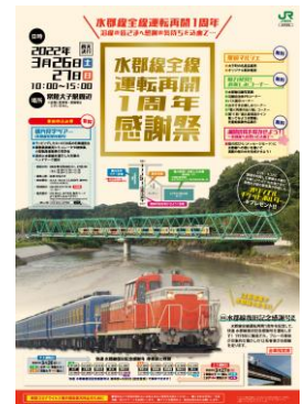
ポスター イメージ