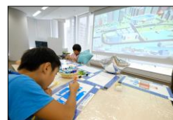
動くぬり絵コーナー イメージ

作成したオリジナルの列車のぬり絵がスクリーンに映し出されて自由に動き回ります。自分だけの動くぬり絵を完成させましょう！