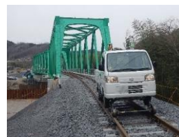
小型軌陸自動車 イメージ