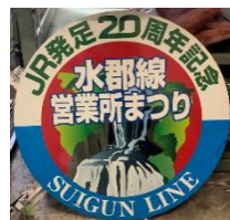
ヘッドマーク イメージ