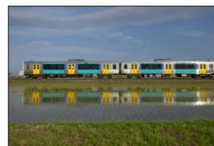
展示写真 イメージ

水郡線沿線の観光情報や地域の魅力をPRします！水郡線沿線は「食」「絶景」「体験」「自然」など肌で感じることができるたくさんの魅力にあふれています。新たな水郡線の魅力を発見してみませんか。