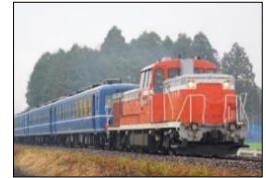
12 系客車 イメージ

水郡線沿線のみなさまへの感謝の気持ちを込めて、臨時快速列車を運転します。1978 年に製造され、ブルーの車体が印象的で懐かしい 12 系客車が水郡線の全区間を走ります。