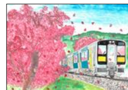
展示作品 イメージ

「水郡線紀行」 https://www.town.ishikawa.fukushima.jp/suigunsen/