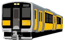
Suigun Line Yellow Happy Train