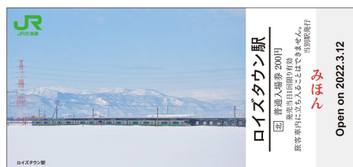
記念入場券（イメージ）