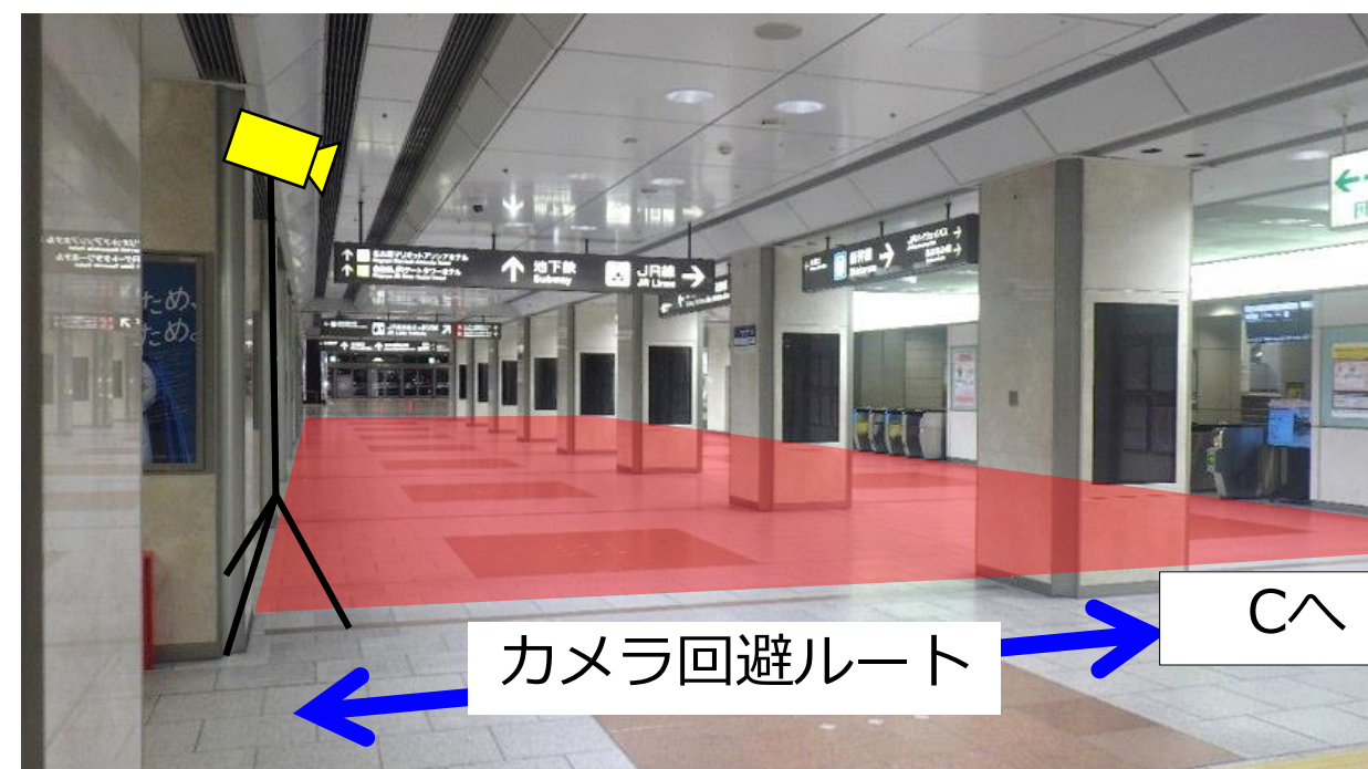
B：新幹線側からタワーズ側を視る

▶ : カメラ設置位置 : 撮影範囲 ↔ : カメラ回避ルート カメラ回避ルートをご通行頂ければ、動画は撮影されません。