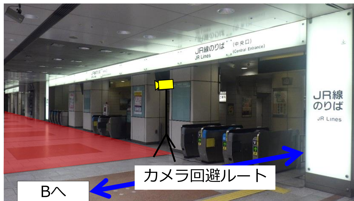
C：新幹線側から中央口を視る