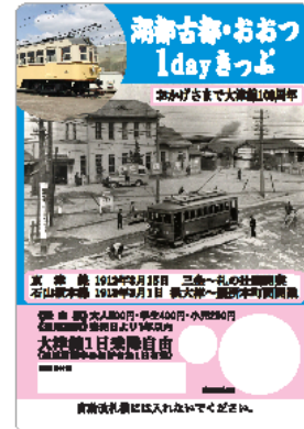
湖都古都・おおつ1dayきっぷ

昭和12年当時の浜大津駅前風景と、かつて天満橋～浜大津間を直通で運転していた往年の名車「びわこ号」が、「湖都古都・おおつ1dayきっぷ」の券面に登場します。