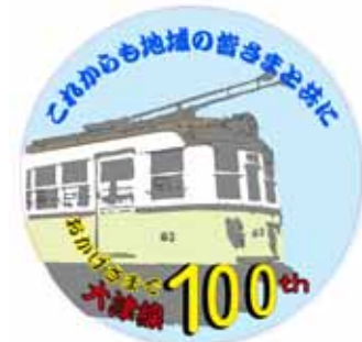
京津線用ヘッドマーク