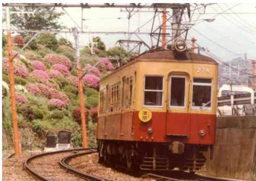
蹴上浄水場付近を走行する京阪本線特急色の260型車両(昭和53年撮影)