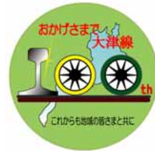
石山坂本線用ヘッドマーク