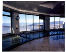
勝沼ぶどうの丘「天空の湯」 （イメージ）