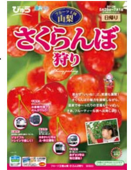
パンフレットの表紙(イメージ)