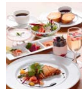
プレミアムフルーツランチ 肉料理(イメージ)