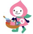
JRの山梨キャラクター「ももすきん」