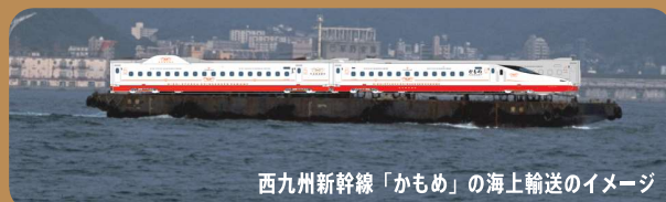
西九州新幹線「かもめ」の海上輸送のイメージ