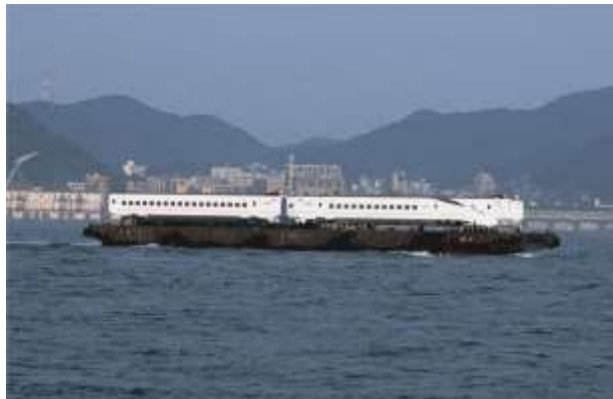
(左:「かもめ」イメージパス © Don Design Associates / 右:過去の海上輸送のイメージ 提供:JR九州)