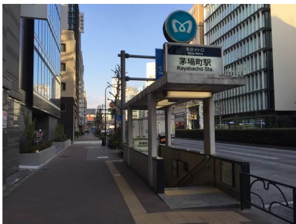
日比谷線茅場町駅 2 番出入口付近