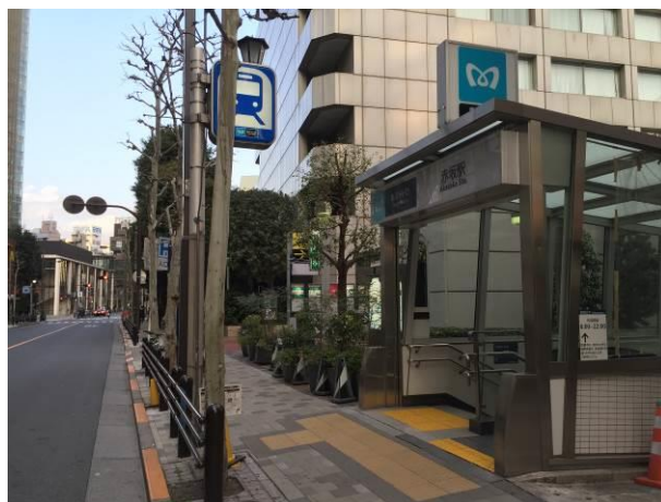
千代田線赤坂駅 6 番出入口付近