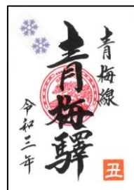
御朱印風駅スタンプ