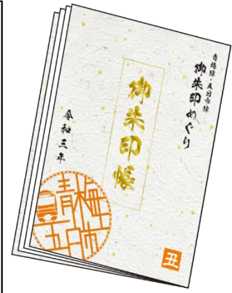
景品：オリジナル御朱印ホルダー

※新型コロナウイルス感染症拡大防止のため、手洗いや咳エチケットにご協力をお願いします。また、お出かけの際には自治体等の最新の情報をご確認ください。