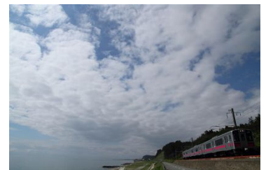
【展示予定写真作品（一例）】