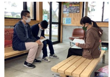
【参考：2021年3月に制作したガニ線カード第1弾（左：表面 右：裏面）】【ガニ線カード第2弾取材風景】